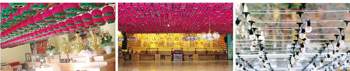
연등 자동 승강장치 _ 대구 여래사