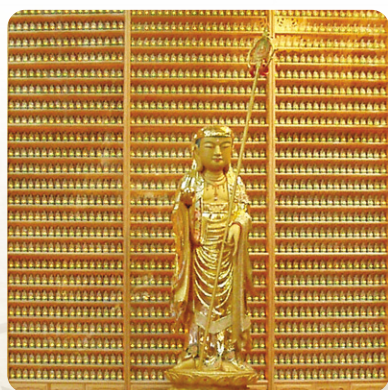
미산 금강정토사 LED인등