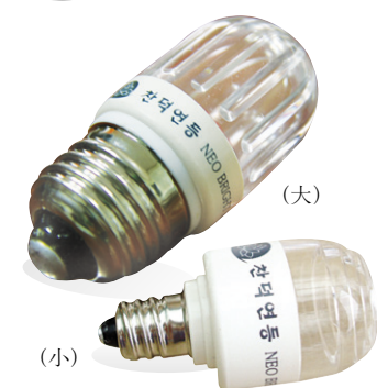
1년 365일, 하루 6시간 사용 전기요금: 98원/1kw/h