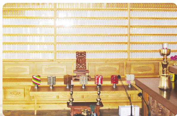
용학사 극락전 영구위패