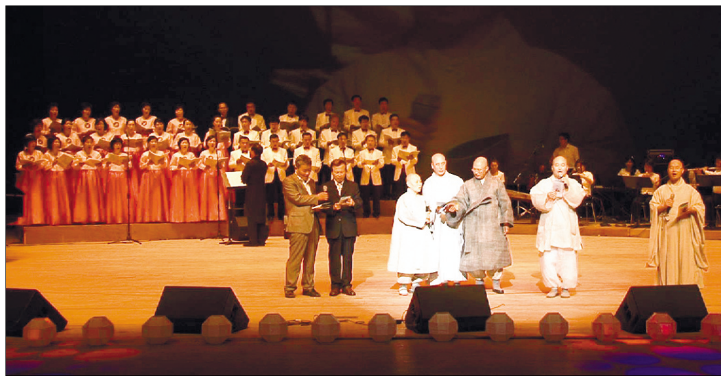
불교 NGO센터 건립 기금 마련을 위한 음악회가 열렸다. 3000여 광주 시민과 불자들이 동참했다.

시명' 등 3곡을 선사한 스님의 음성 공양에 신도 몇몇은 감동의 눈물을 보이기도 했다. 관음무용단의 '홀로 핀 연꽃', '마음의 혼불이 꽤' 등 관음춤 관객들의 관심을 불러 모았다. 행사 마지막에는 참가자 전원과 관객들이 함께 부르는 '아미타불 나 의 남'이 대극장에 울려 퍼졌다.