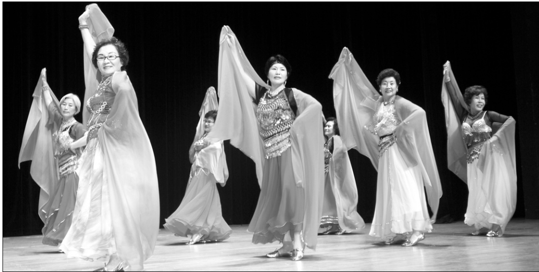
6월 14일 열린 연꽃마을 예술제에서 어르신들이 공연을 하고 있다. 연꽃마을 예술제에서는 연꽃마을 산하 요양시설, 노인복지관, 종합사회복지관, 어린이집 등에서 22개 팀이 대회에 참가해 경연을 벌였다. 행사에서 각현 스님은 “문화·예술분야의 노인축제가 자리매김해 노인들이 삶의 자긍심을 가질 수 있게 도와야 한다”고 말했다.

연꽃마을 예술제에서는 연꽃마을의 40여 산하 시설을 이용하고 있는 노인, 어린이, 장애인들로 구성된 공연팀의 공연이 펼쳐졌다. 또 대화중합사회복지관, 용인노인복지관, 부천시원미노인복지관, 평택북부노인복지관, 일산노인종합복지관, 평택남부노인복지관, 방배노인종합복지관, 부곡종합사회복지관, 평택시노인전문요양원, 파라밀요양원, 용인노인요양