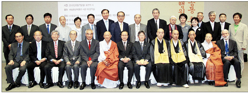
6월 7일 발족한 고려초조대장경 한·일 공동복원위원회 위원 및 고문들.

고려 초조대장경 조성(1011년) 1000년을 맞아 한·일 공동 복원간행위원회가 발족했다. 한국과 일본, 미국 등 대장경 연구 인력이 결집·구성된 복원간행위원회는 앞으로 5년간 소설됐던 초조대장경을 복원한다.