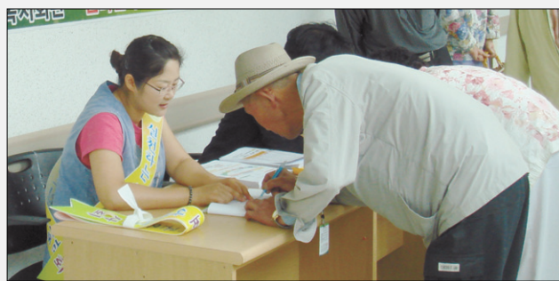
고창종합사회복지관에서 진행한 노인학대예방캠페인에서 노인학대 예방수칙 알기, 노인학대 예방을 위한 지역주민 서명운동이 진행됐다.

고창군종합사회복지관·(관장 장도환)은 6월 6일 복지관에서 400여 농어촌지역 저소득 어르신에게 '건강나눔 의료봉사'를 실시했다.