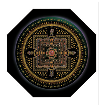
팔각원형 디자인의 만다라.

'마이트레아 프로젝트 심장전'의 책임자인 카르멘 스트레이트 씨는 당시 종오 스님과 동행했던 광주방송 박종삼 촬영감독에게 "우리가 보관하고 있는 불교성인 39위 사리 3000점을 최첨단기법을 통해 재현하여 보관하고자 한다"며 협조 요청했다. 이 협조요청은 "어떻게 하면 당시의 감동을 불자들에게 나눌 수 있을까"를 고민하던