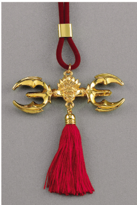
부처님 제1의 비방법구

경기가 너무 어려워, 장사가 너무안되어, 문을 닫아야겠어, 요즘사업을 하는 중생들의 푸념이다. 반면 목도 안중고 불경기에도 흥망을 누리는 점포와 사업장도 많다. 부자가 되는 터가 있고, 패망하는 터가 있고, 그리고 항상 겨우겨우 먹고사는 터가 있다. 한 건물 한지붕 밑에서 동