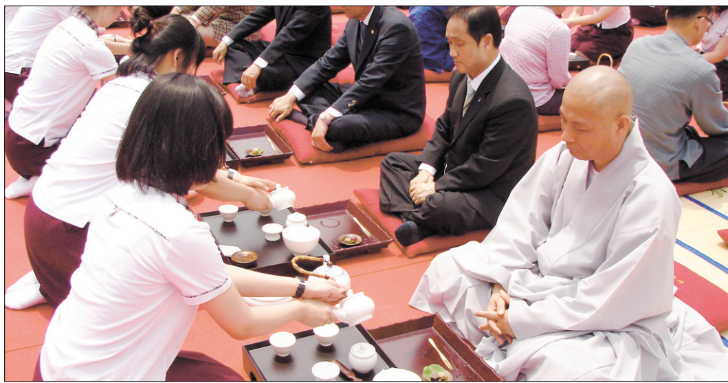
고창 선운사에서 진행된 2010 헌다례에 참여한 군산여고, 강호항공고, 고창고교생 108명이 헌다례 의식을 직접 재현하고 있다.

이번 행사는 조상께 올리는 정성, 어른께 올리는 존경, 이웃과 나누는 사랑의 선운삼다레 의식으로 청소년들이 직접 재현해 우리문화의 우수성과 아름다움을 계승하고자 마련됐다. 특히 헌다례에는 조선 시대, 종묘 제향에서 첫 잔을 올리는 일을 맡아보던 제관인 초헌관(初獻官), 두 번째 잔을 올리는 제관 아헌관(亞獻官), 세 번의 잔 가운데 마지막 잔을