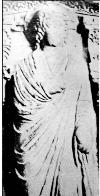
상을 비교하며 종교간 문화의 간극을 좁히는 시도를 했다.

이정구 교수는 '3-5세기에 나타난 그리스도 조상(彫像)과 불상 이미지'의 주제발표에서 예수의 이미지가 최초의 조각으로 나타난 3-5세기를 기준으로 삼아 동시대에 제작된 인도 파키스탄 지역의 간다라 불