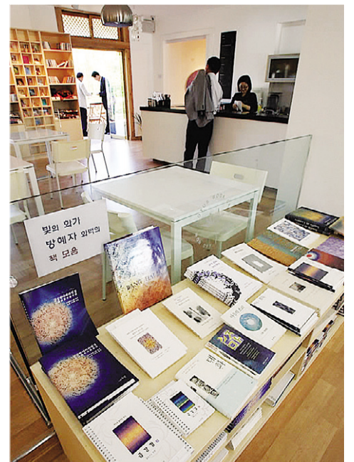
도심문화공간으로 거듭난 광주 무각사는 시민들의 사랑을 받기 위한 다양한 프로그램을 진행할 예정이다.

과 함께 할 수 있는 정신적인 공간을 만들고자 준비했다”며 “이웃과 더불어 숨 쉬고 이웃의 삶에 단단히 뿌리내리는 진정한 시민의 도량이 되도록 하겠다”고 말했다.