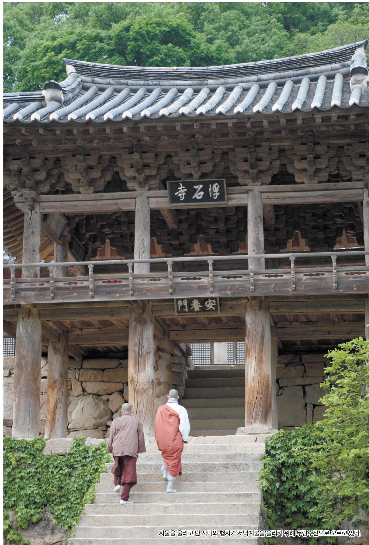
사물을 올리고 난 사미와 행자가 저녁예불을 올리기 위해 무량수전으로 오르고 있다.