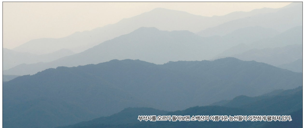
부석사를 오르다 돌아보면 소백산의 아름다운 능선들이 의젓하게 펼쳐져 있다.