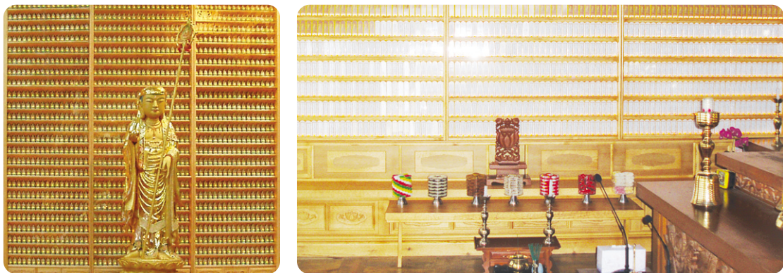
마산 금강정토사 LED인등