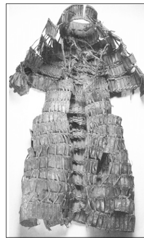
8세기 경 토번제국의 갑옷.

토번 왕조는 7-9세기에 이르기까지 2000여 년간 티벳 역사상 최고의 권력을 가진 왕조였습니다. 티벳 고원의 중앙에 성립된 고대왕국 토번은 라사 남동의 아르룬부(통기 지방)를 기점으로 근처의 여러 부족을 흡수해 세력을 확장했습니다. 630년 송첸감포 왕(재위 630-650년)이 즉위 했습니다. 송첸감포 왕은 633년 스키타이를 평정한 후, 수도를 라사로 정하고 티벳 왕조를 열었습니다. 이 통일 정권의 왕조를 당나라에서는 ‘토번’이라고 불렀고, 이 명칭은 14세기 중순까지 사용했습니다. 이는 토번의 왕이 자칭으로 성을 가지지 않았으며, 왕가와 왕족도 호칭을 갖지 않았기 때문에 이 왕조의 명칭을 토번으로 하는 것이