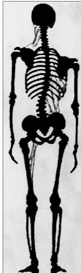
어깨 비대칭 골격도.

어깨의 불균형 증상은 어깨 주변 근육과 인대의 경직과 근육의 손상을 유발시키는 만성적인 근·골격계 질환입니다. 어깨는 옆에서 보았을 때 앞으로 굽은 정도에 따라 전신이 다르게 보입니다. 이 증상은 좌우 견갑(어깨뼈)과 쇄골의 비대칭 및 척추의 휘어짐에 그 원인이 있습니다. 또 측만증 증상이 있는 경우에 어깨의 높낮이가 다를 수 있습니다. 어깨 비대칭을 교정하는 것은 미적 관점으로 전신 균형을 맞춘다는 측면에서 그 중요성이 강조됩니다.