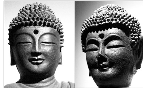
국립중앙박물관에 전시된 통일 신라 말~고려 초에 만들어진 비로자나불(왼쪽)과 10세기 고려시대에 만들어진 부처님의 모습이다. 부처님의 미소에서 그의 인간미를 엿볼 수 있다.

웃음에 대한 다른 말로는 ‘하루 100번 웃으면 10분 동안 노를 젓는 것과 똑같은 운동효과가 있다’, ‘웃음의 효과는 운동의 효과처럼 축적된다’, ‘일상생활에서 위기를 극복하는 방법으로 유머를 사용하면, 전염병에 대항하는 항체의 양이 다른 사람보다 많다’, ‘웃음은 분노를 삭여서 심장마비를 예방한다’, ‘맑이 웃는 사람은 호흡 기능이 향상되고 면역세포의 활동이 증가된다’ 등이 있다. 매일 목표를 정해서라도 웃어야 한다. 웃음 속에서만 담겨진 마음이 열릴 수 있다. 창의력이 샘솟을 수 있다. 암에 걸렸던 어떤 일벌레 환자가 1년 내내 유머 비디오·넌센스 책을 보면서 웃기만 했더니 암이 다 치료됐다는 사례도 있다. 웃음은 자연치유력을 극대화하는 보약이다.