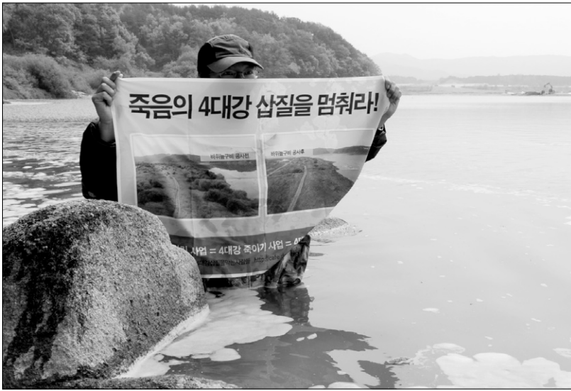
여주 여강선원에서 활동 중인 한 시민이 공사가 진행 중인 강으로 들어가 공사 중단을 촉구했다.