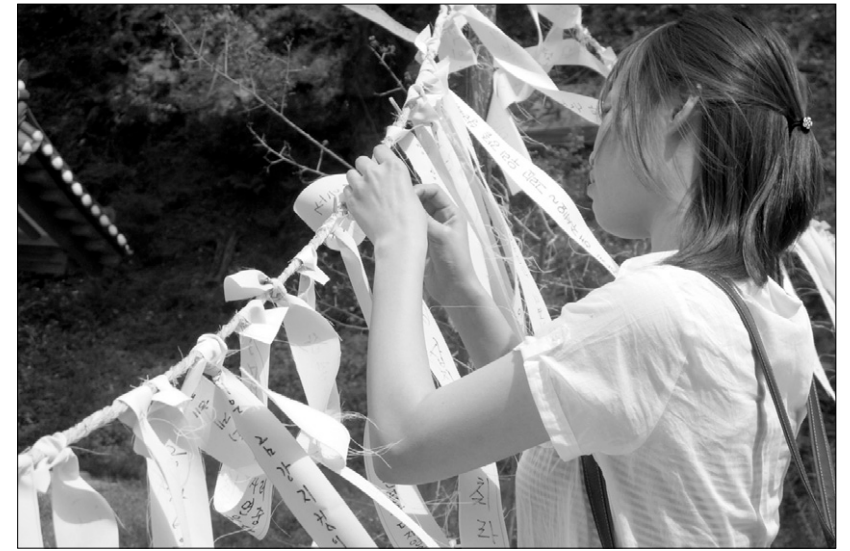
공주 금강선원을 찾은 공주대 학생이 4대강 공사중단을 촉구하는 소원지를 묶고 있다.