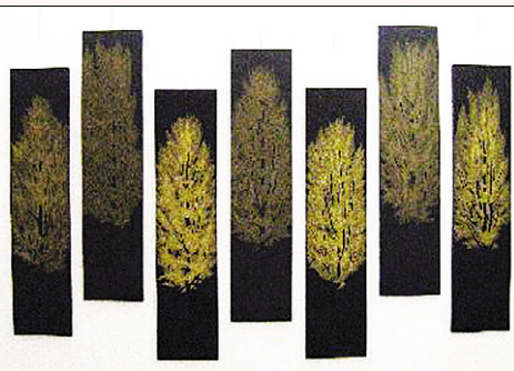
진분홍 작가의 ‘무제’.

2009년 북한문화공간인 스페이스 선+의 신진작가 공모전에 당선된 진분홍 작가는 전통미술이