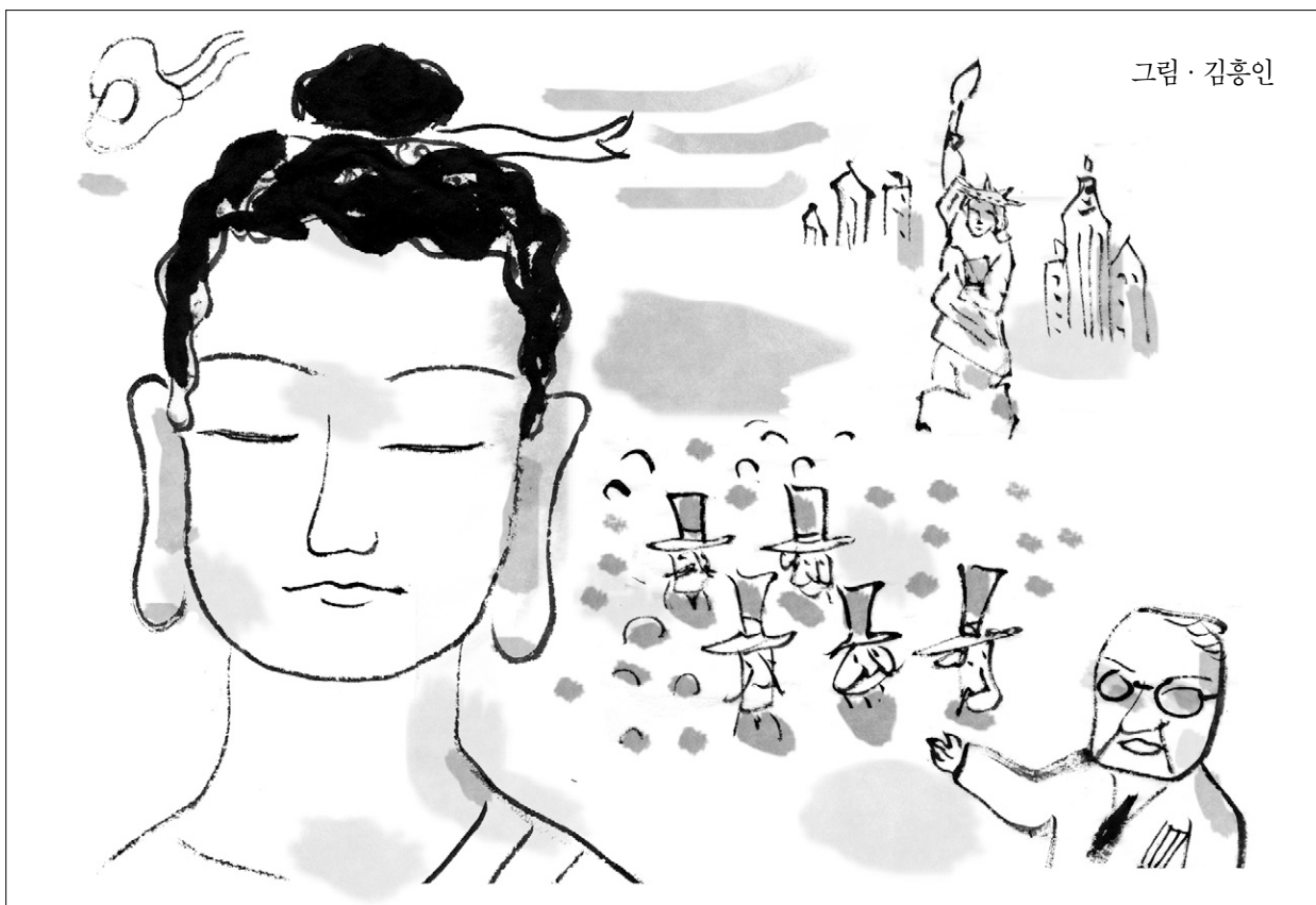
그림 · 김흥인

<한위양진남북조불교사>는 내용이 2부로 나뉘어 있는데, 1부는 한대의 초전불교를 집중적으로 연구했고, 2부는 위진·남북조의 불교를 논했다. 특히 2