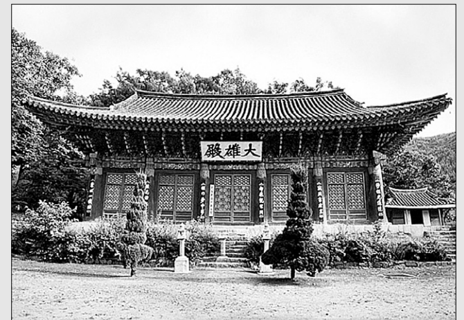
보물 제500호 논산 쌍계사 대웅전.

충남 논산의 쌍계사 대웅전(보물 제408호)과 경북 하동의 쌍계사 대웅전(보물 제500호)이 '논산 쌍계사 대웅전'과 '하동 쌍계사 대웅전'으로 바뀐다.