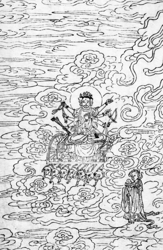
고려화박물관 소장 <석씨원류(釋氏源流)> 중 천모호신(天母護身). 불암사 판 1673년간행, 반곽(半郭) 27.2×18.0cm

“무슨 법으로 그것을 면할 수 있습니까? 지교를 내려 주시기 바랍니다.” “남마다 마리천보살의 이름을 700번 두루 염송해 공중을 향해서 천조의 현인들에게 회향할 수 있다면 사자에서 이름을 지을 수 있고 전쟁의 재역에서 면한다.” 이에 이각이 절을 하고 사례를 올리자 그는 수레를 타고 그곳을 떠났다. 이때부터 이각은 그치지 않고 마리천보살의 이름을 숭지 했더니 난을 면하게 됐다. 염송법에 이르기를 “나무석가모니불을 열 번 소리 내어 부르고 ‘나무마리천보살’ 700번 소리 내어 부르라”고 했다. <최상심진언>에는 “옴 마리천 사바하를 700번 소리 내어 부르고 원상호아제자사바하(願常護我弟子娑縛質) 부르라”라고 했다. 이러한 의식은 <불설마리천보살다라니경(佛說摩利支天菩薩陀羅尼經)>을 외면서 각종 재난이 없게 되기를 기원하는 불교의식인 마리천도량(摩利支天道場) 의식으로 이어졌으며 우리나라에서도 고려시대에 개설(開設)돼 병재(兵災) 예방의 목적으로 이용됐다.