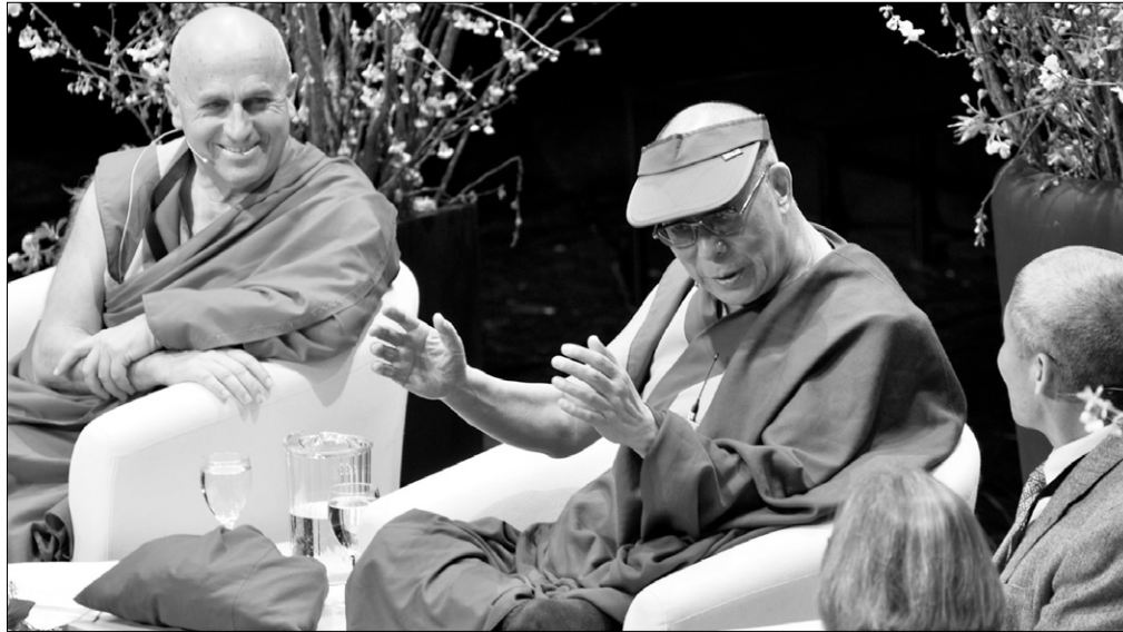
4월 9~11일 스위스 취리히에서 열린 '이타주의와 관용의 경제학' 포럼에서 여러 전문가들과 대화를 나누는 달라이 라마.

현대 경제학은 소비가 경제활동의 유일한 목적이라고 정의해 왔다. 그러나 대량 생산과 편향된 이윤 추구에 의한 성장은 결국 거품경제를 초래했다. 대량 실직은 증가하고, 빈부의 격차는 더욱 커졌으며, 가족은 붕괴됐다. 인간의 부정부패와 탐욕에 의한 결과이다.