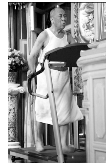
달라이 라마는 새벽 3시에 일어나 땀뻘기울인다.

또한 제작팀이 달라이 라마와 헤어진 후 러시아로 돌아가는 동안, 그의 메시지를 깨닫는 과정 등은 영화에서 또 다른 의미를 부여한다. 달라이 라마 14세가 전하는 전 세계 인구 과밀과 빈부격차, 세계적인 분쟁 등을 주제로 나눈 대화 속에 오고갔던 많은 말들이 잘나에 큰 울림을 전하고 있다.