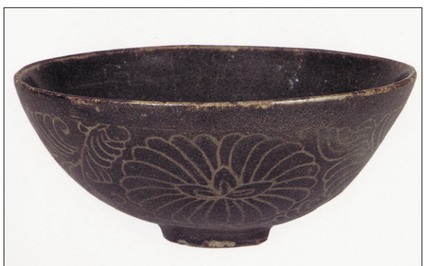
청자철채음각 보상화당초문 완(靑磁鉄彩陰刻寶相華堂草文碗). 일본 오사카 동양도자미술관 소장. 입지름 10.8cm.

<고려도경>은 40권으로 구성됐다. 그 중 <관사(館舍)> <기명(器皿)> 편에 고려의 음다풍속과 다구의 유형 등을 살펴볼 수 있는 기록이 남아있다.