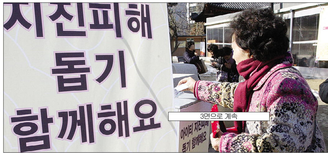
조계종의 아이티 구호기금 마련 행사에서 한 불자가 기부하고 있다.

모금 역시, 조계종의 ‘아름다운 동행’을 비롯해 태고종, 천태종이 각각 마련한 구호기금은 (아이티 구호 등) 사찰별로 목적을 갖고 모인 금액이 아닌 시주함에 모아진 금액을 전용한 경우가 많았다. 특히 ‘아름