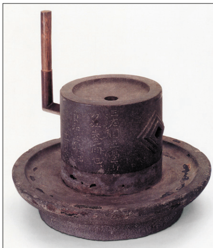
전송 유송년 연다도 부분(傳宋 劉松年 搗茶圖 部分). 대만고궁박물관 소장. 높이 25cm, 다구상단 지름 19.3cm, 다구하단 지름 35.7cm.

“연은 은으로 만든 것이 제일 좋고 속철로 만든 것이 그 다음으로 좋다. 생철로 만든 것은 두드러 제련한 것이 아니면 쇠가루가 (찾가루) 뜰에 끼게 돼 차의 색을 해치는 것이 더욱 심하다. 연을 만들 때는 몸통이 깊고 커야 하며 등근 바퀴는 예리하고 좁아야 한다. 몸통이 깊고 크면 바닥이 평평해 끼지 않고 차가 항상 모이게 된다. 등근 바퀴가 예리하고 좁으면 몸통 안에서 움직이되 몸통이 흔들리지 않는다. (중략) 연을 갈 때는 반드시 힘을 주어 빨리하고 오래 하지 않아야 한다. 철이 차색을 해칠까 두렵기 때문이다(碾以銀爲上熟鐵次之生鐵者非拘揀錫磨所成間有黑屑藏于隙穴害茶之色尤甚凡碾爲製精欲深而峻輪欲銳而薄槽深而峻則底有準而茶常聚輪銳而薄則運邊中而槽不礙(中略)碾必力而速不欲久恐鐵之害色.)”