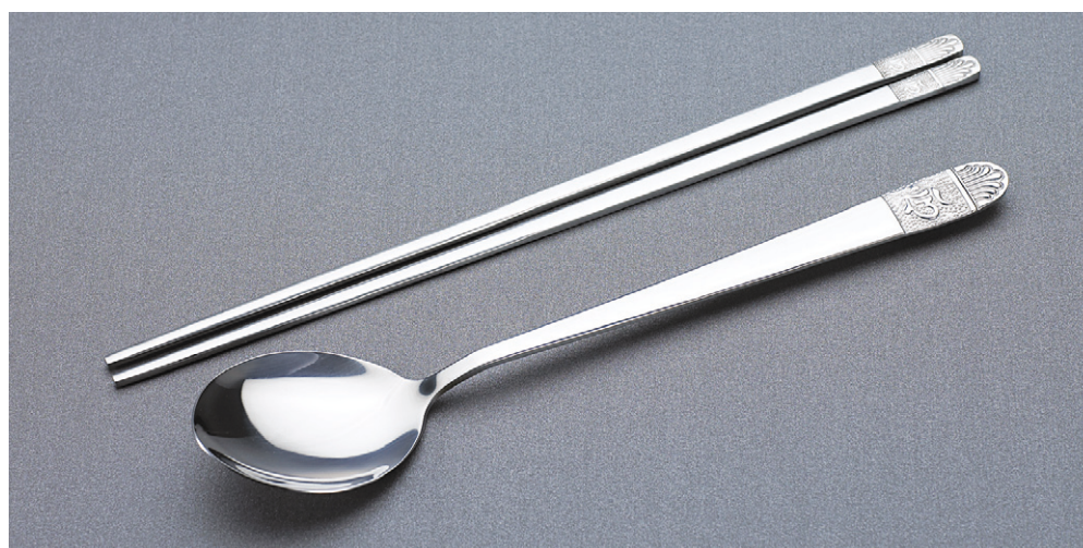
“다라니수저” 출시기념 공장도가 시판

세상에서 제일 아름다운 수저 불자가정에서도 사용하게 품질은 최고! 디자인은 세련!