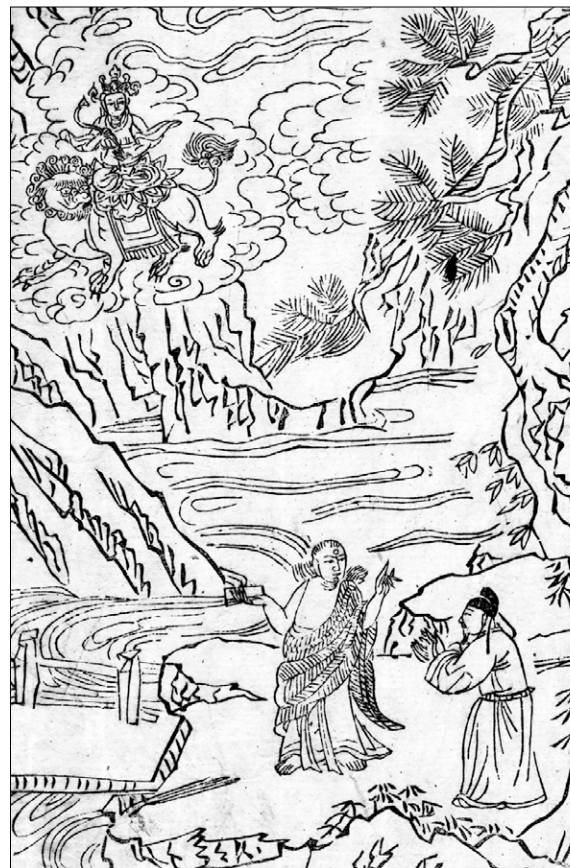
고판화박물관 소장 <석씨원류(釋氏源流)> 중 초의문수(草衣文殊). 불암사판 1673년간행, 반곽(半郭) 27.2×18.0cm