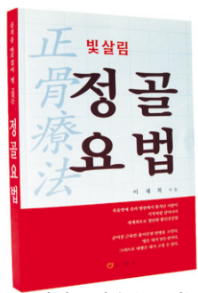
이재복 저음 (270면)

폐결핵으로 한쪽폐가 없어지고 간경화, 위궤양, 대장염으로 복수가 차서 피를 토하고 쓰러져 죽음의 문턱까지 갔던 사람이 병원에서 마저 쫓겨나 죽음을 기다리다 무심코 「발치기」운동으로 살아난후 세계최초로 창안한 활인건강법!