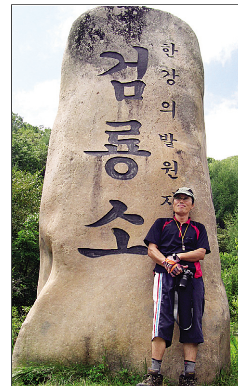
검룡소 새김돌 앞에서 필자. 이곳에서 심리쯤 들어가면 한강의 발원지인 검룡소가 있다.

우리시대 영월의 가슴에 남은 전사 김남주 시인은 낮 놓고 기억자도 모른다고 편지를 하는 주인을 그 낮으로 죽인 머슴을 시로 그려내기도 하였으나, 우리의 역사에는 주인을 위해 착하게 죽은 머슴이 설화로 전해오고 있습니다. 객적계 된 왕은 머슴을 기리기 위해 손돌의 무덤을 만들어 주었고, 백성은 손돌의 원혼을 달래려는 제사를 해마다 음력 상당(시월)에 지낸다고 합니다.