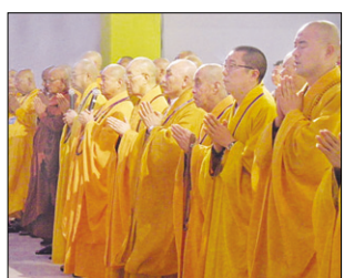
세계 고승 존증사단