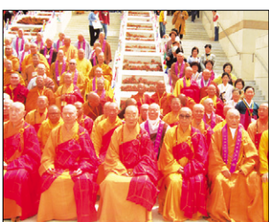
세계 고승 아사리단