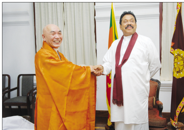
스리랑카 대통령과 함께 금강보살계를 받읍시다