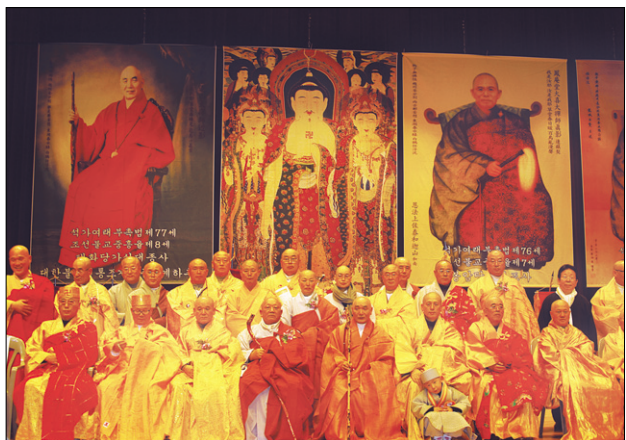
국내 고승 금강보살계단 존증사단

기미년3.1독립운동 민족대표와 11.3광주학생독립운동 학생대표 추모를 위한 국제전수금강보살계 대법회를 봉행합니다. 세계불교승가회 세계적인고승들을 아사리와 존증사로 초빙하였습니다. 외국신도 약 100여명이 동참하고 스리랑카대통령께서는 장관, 보좌관등 100여명과 스리랑카고승 50 분이 함께 이법회에 참석하시겠다고 3월9일 오후6시 대통령접견실에서 선언하셨습니다. (관계부서에 청원서, 경위서 등을 제출하였으므로 참석하실수 있도록 관계당국의 승인을 기다리는 중입니다.) 한국불교의 대표적인 용성조사율맥으로 받는 국제전수금강보살계에 동참하시어 스리랑카대통령님과 함께 계를 받는 수승한 인연을 맺어 모든 불자들에게는 보리심을 증장시키길 바랍니다.