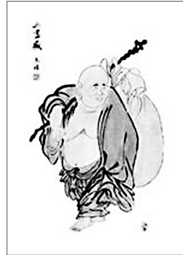
동성 스님 작

부득이 우리가 생명을 유지하기 위해 무엇인가를 해야 할 때 산천초목이 다 생명이라고 한다면 무엇을 해도 이익이 안 된다면 무엇을 해야 하는가를 의심하게 될 것입니다. 부득이 다른 생명을 해쳐야 한다면 최소한의 업을 지어야 하기 때문에 항상 마음으로 정진의 끈을 놓지 않는 것이 업에서 벗어나는 길입니다. ■ 청주 혜은사 주지