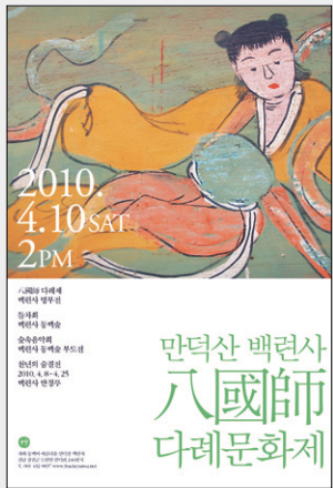
4월 10일 강진 백련사에서 열리는 팔국사 다례문화제 포스터.

이와 함께 부도밭에서는 초의 차문화회(회장 여연) 주관으로 들차회가 진행된다. 청소년을 위한 ‘아함 해장선사와 다산 정야