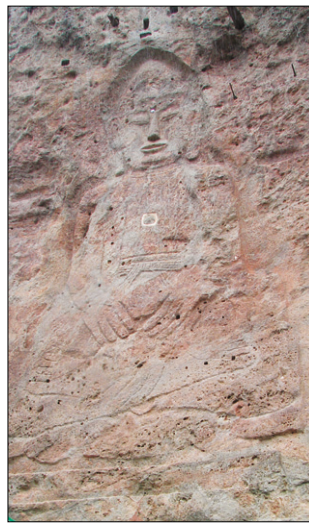
새로 단장된 선운사 도솔암 마애불(보물 1200호).

한편, 미륵불로 불리는 미륵불의 배꼽부분에는 석회로 메운 흔적이 있다. 그 안에는 선운사를 창건한 김단 선사의 신기한 비결(秘訣)이 숨겨져 있다는 전설이 내려오고 있다. 동학농민전쟁 당시 무장집주 손화중 등 주도세력들이 민심을 모으기 위해 불상의 배에서 비결을 꺼낸 것으로 유명하다. 미륵의 출현을 내세워 민심을 모으기 위해 이 비기를 꺼내는 사건이 벌어지기도 했다. 당시 스님들의 저항을 뿌리치고 동학농민운동의 주도세력은 배꼽부분을 도끼로 부숴냈다. 실제로 동학도의 손에 비결이 들어갔는지는 전해지지 않고 있지만 당시에는 비결을 넣었다는 소문이 퍼지면서 사람들이 모여들기 시작했다. 3개월 후인 11월 3일 추운 겨울날씨에도 동학도 수천