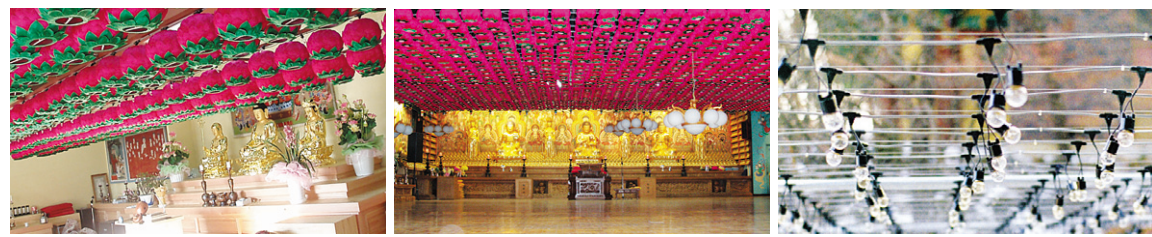
연등 자동 승강장치 _ 대구 여래사 연등 자동 승강장치 _ 서울 화계사 외부에 시공된 전선케이블

전선(케이블) _ 연등승강장치 天上列車 ※ 이제는 범당 연등 설치도 버튼 하나로 해결하세요.