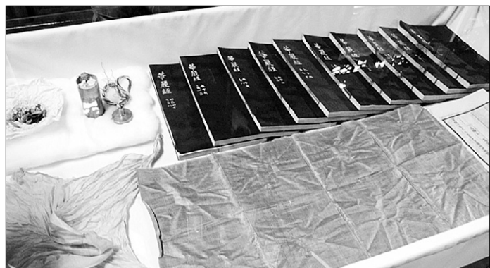
보물 제1621호 지장암 목조비로자나불좌상(위), 비로자나불좌상 밑바닥에서 발견된 경전들과 복장품 및 후령통.

여한 조각승들은 당대의 명장들이 대부분이었기 때문에 그들이 조성한 불상들은 시대를 대표할 만한 매우 중요한 작품들이었고, 목조비로자나불좌상이 대표적이다”고 설명했다.