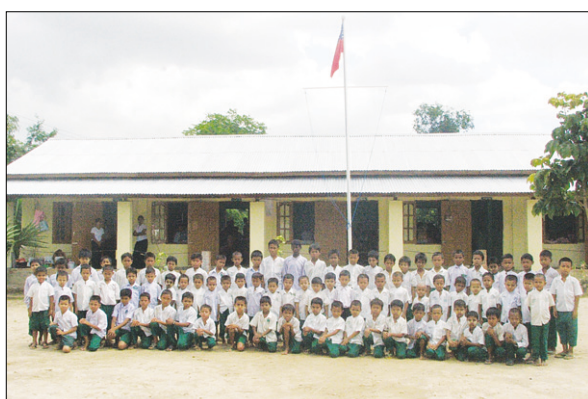
극빈지역 초등학교 설립

극빈지역 초등학교 설립, 빈약한 사찰 보수지원, 우물파기 운동, 승려 교육자료 지원, 극빈지역 출가의식 지원, 국제회의 개최 및 지원, 국제붓다사리 박물관 및 미얀마 연방정부 한국주재 문화원 개원(공식승인), 수해지역 복구지원, 학교건립 자선바자회, 이외에도 예술인 상호교류 공연, 교육자재지원, 이웅산묘지 폭파 순국선열 천도제, 비구니 스님 수행처 건립 제공 등 일일이 열거할 수 없는 많은 나눔의 행사를 봉행하여 왔습니다.