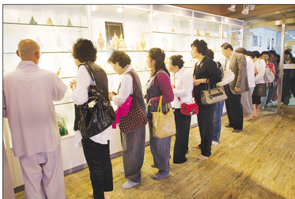
미얀마 문화원 개원