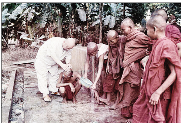
우물파기 운동 전개