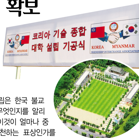
한국 종합 기술 대학 조감도

본 한국 종합 기술 대학 설립은 한국 불교가 국제사회에서의 역할이 무엇인지를 알리는 목탁 역할을 할 것이며, 이것이 얼마나 중요한 부처님의 가르침을 실천하는 표상인가를 보여주도록 최선을 다하겠습니다.