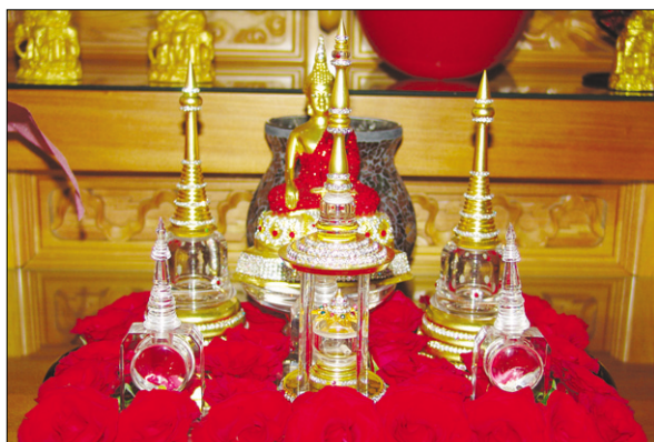
국제 붓다사리 박물관