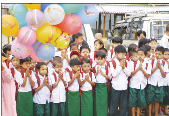
극빈 초등학교 지원