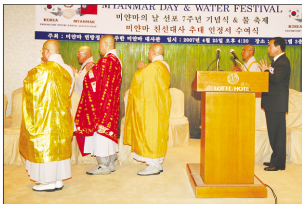
미얀마의 날 행사