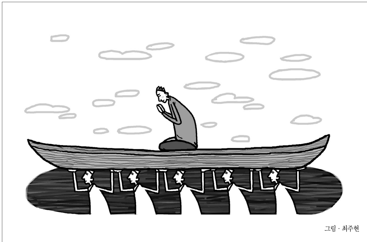
그림 · 최추현

그래서 부처님께서서는 이렇게 말씀하셨습니다. "너희가 빈집이라면, 주장자가 없는 빈집이라면 거미도 치고, 온갖 무리들, 잡 생명들이 다 그 집을 헐어 나가느니라." 그러니까 반드시 주인을 발견해서 세워라, 이런 뜻이죠. 가끔 이렇게 보면 주인을 지니지 않고 사는 사람 다르고 주인을 지니고 사는 사람 다른데, 주인 없는 사람은 죄 여여하