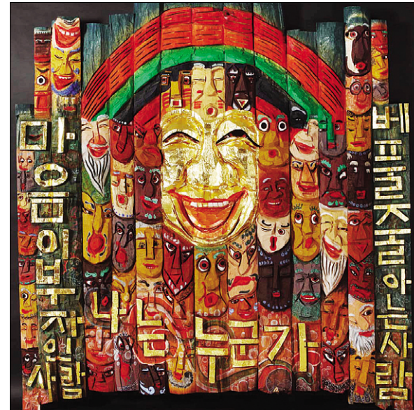
영국 런던 트라팔가에 소재한 주영한국문화원에서 전시될 박찬수 목조각장의 '나는 누구인가'.

추규호 주영대사는 "이번 전시는 한국의 불교미술의 아름다움을 알리고, 양국의 수준 높은 문화를 다각적으로 향유할 수 있는