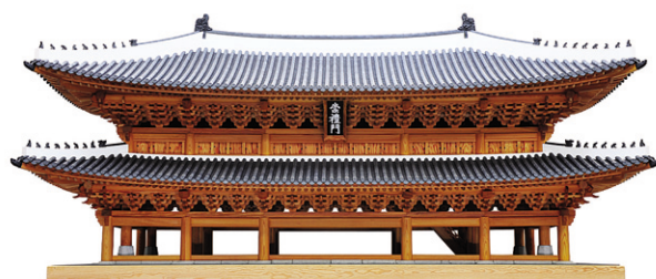
2년 전 화재로 소실된 승례문을 재현했다.

우리나라 목조건축물의 변천사를 한 눈에 파악하고, 감상할 수 있는 자리가 마련됐다. 국립중앙박물관(관장 최광식)은 상설전시실 1층에서 '우리 목조건축, 어떻게 변해왔나' 전을 6월 27일까지 연다.