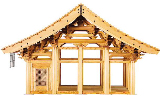
수덕사 대웅전의 측면 모습.