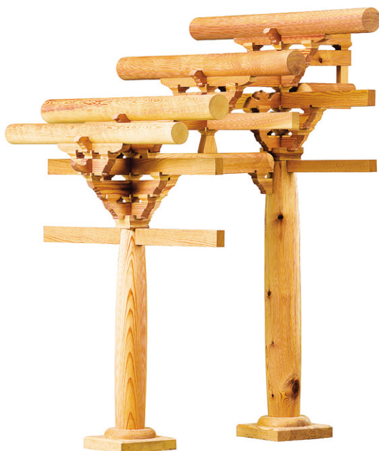
부석사 무량수전의 주심포 기둥과 배흘림 기둥.