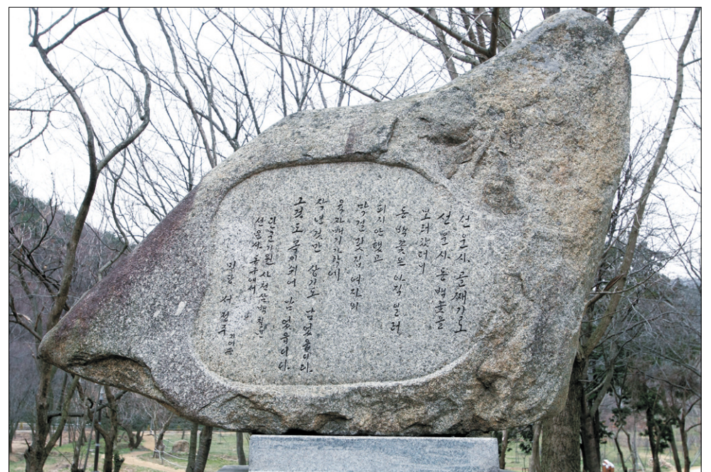
'선운사 동구'가 새겨져 있는 미당의 시비가 이제는 볼 수 없는 시인의 모습을 대신하고 있다.