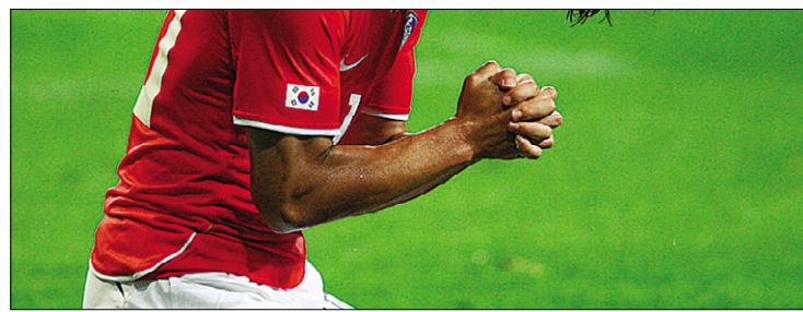
수많은 이들이 지켜보는 가운데 올리는 특정종교만의 세레머니는 사회화합을 해칠 수 있다. 모든 국민이 하나로 뭉칠 수 있는 한미담이 되기 위해 사회 구성원 각자의 성숙된 신앙표현이 필요할 때다.

빚었다. 스코틀랜드 축구의 양대 산맥 셀틱과 레인저스가 벌이는 ‘올드 펌 더비’는 축구 외적인 면에서 더 유명하다. 아일랜드에 뿌리를 지닌 셀틱은 스코틀랜드 내의 가톨릭계를 상징하는 반면, 스코틀랜드의 자존심 레인저스는 개신교에 뿌리를 두고 있다. 20세기 초 아일랜드가 스코틀랜드로부터 독립하며 나타난 민족·종교 대립은 세계 축구 역사상 가장 악명 높은 라이벌 관계로 자리매김했다.