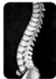
정상적인 척추(왼쪽)와 과도하게 휘어져 전만 된 척추(오른쪽).