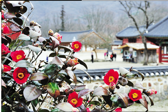
위에서부터 통도사 서운암의 들꽃축제 풍경, 봄을 가장 먼저 알리는 산수유 꽃, 선운사 경내에 붉게 피어난 동백꽃의 모습

"Oh! Beautiful day, Oh! Beautiful life. 따뜻한 햇살 그 봄바람에 취해 볼까?"