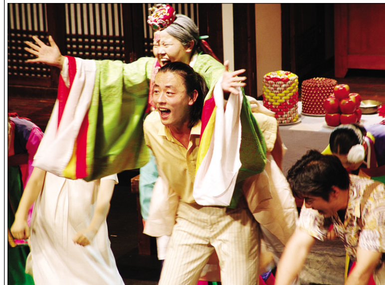
연희단거리패가 공연하는 '오구'의 한 장면.

이윤택 감독의 연희단거리패와 대표작품인 연극 '오구'가 1991년 독일 에센 세계연극제 이후 20년 만에 본래 고향인 가마골소극장으로 돌아왔다. 국내에서 드물게 최장기간 공연되고 있는 '오구'는 '귀신연극'이라는 수식어가 붙을 만큼 오랜 시간동안 사람들에게 사랑받아왔다.