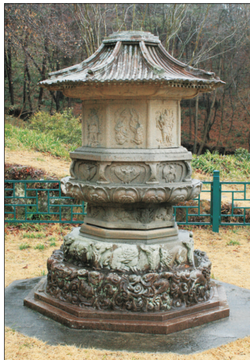
국내 부도 가운데 최고의 걸작으로 꼽히는 철감선사 부도.

팔각의 몸통은 배흘림기둥을 세웠고 기둥 윗부분은 목조건축의 짜임 수법을 그대로 보여주고 있습니다. 팔각원당형의 석조부도는 목조건축의 구현임을 다시 한 번 확인하게 됩니다. 앞뒤로 문비를 둔 탑신석에는 웃것하나까지 세심하게 표현된 사천왕상과 비천상이 면마다 정교하게 조각되어 있는데 철감 선사의 사리는 그 안쪽 어딘가에 있었을 겁니다. 사리를 흠치려는 사람이 이 부분을 노리