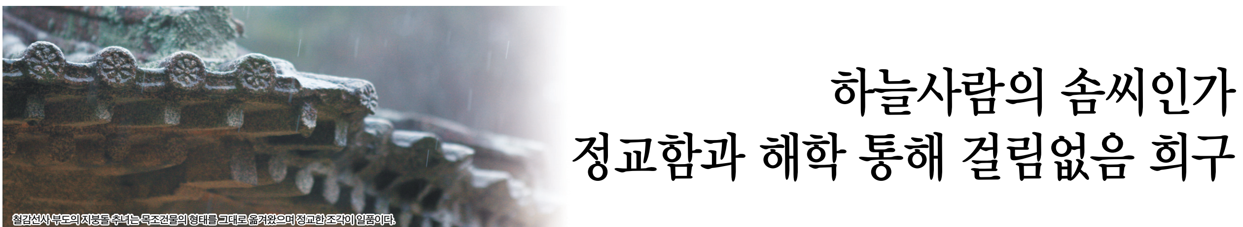
철감선사부도의지붕을수놓는목조건물의형태를그대로 옮겨왔으며정교한 조각이 일품이다.