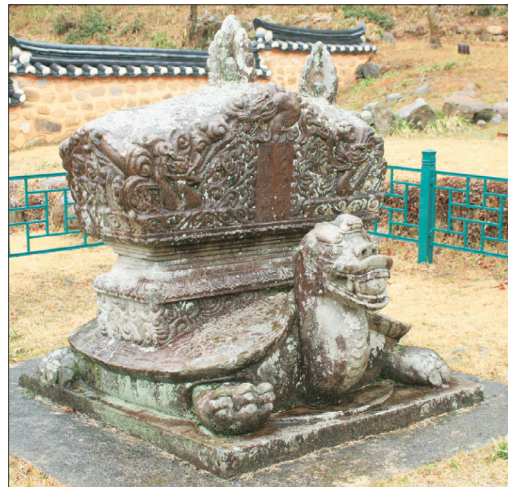
앞으로 나아갈 듯한 자세를 취한 귀부.

는 사람들이 내려와 밤사이에 덩그러니 조성해 두고 올려갔을 것이란 생각을 하게 됩니다. 그렇지 않다면 사람의 정성이 하늘을 감동시켜 석공에게 자신도 모르게 솜씨를 업그레이드 시켜 주었을 것일 겁니다. 철감 선사 부도 앞에서 서 있으면 누구나 그렇게 믿고 싶어질 것입니다.