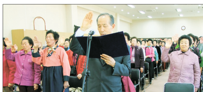
고창지역 어르신들이 활기찬 노년인생을 위한 노인일자리 창출을 발원하고 있다.

무공 스님은 “오늘날 풍요롭게 사는 것은 지금의 어르신들이 흘린 땀의 결실이며, 경제가 어려운 시기 일수록 어르신들의 풍부한 경험과 신중함이 더욱 절실하다”며 “어르