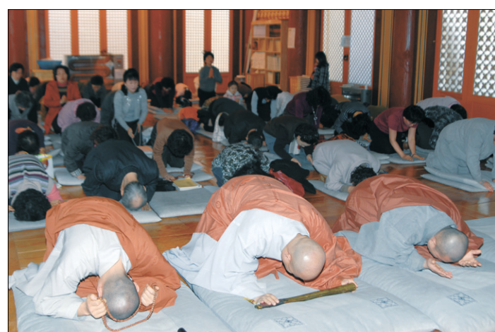
광주지역불자들이 소아암·백혈병 어린이 완치를 기원하는 1만배정진 기도를 봉행하고 있다.

모금되는 후원금은 아픔에서 고통 받고 있는 아이들에게 전달된다. 많은 사찰과 불자들의 참여를 부탁한다"고 당부했다.