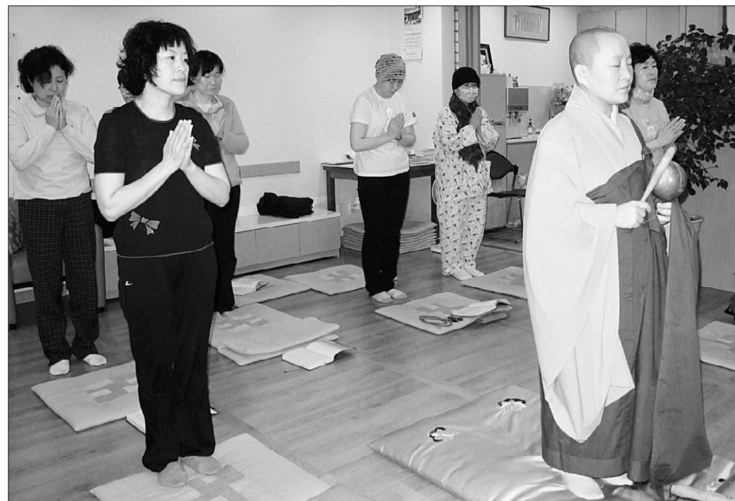
오전 11시가 되자 환우 가족들이 하나둘씩 모여 예불에 동참하고 있다.