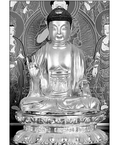
보물 지정된 문경 대승사 금동아미타여래좌상

(보물 제1638호) △대구 동화사 보조국사지눌진영(보물 제1639호) △문경 김룡사 영산회괘불도(보물 제1640호) △상주 남장사 감로왕도(보물 제1641호) △안동 봉정사 영산회괘불도(보물 제1642호) △안동 불경사 아미타설법도(보물 제1643호) △예천 운문사 천불도(보물 제1644호) △안동 광흥사 동종(보물 제1645호) △조조본 불설가섭부불반열반경(보물 제1646호) △길흥축월회간 목판(조물 제1647호) △예천 명봉사 경청선원자적선사능운탑비(보물 제1648호)이다. 이는 문화재청이 불