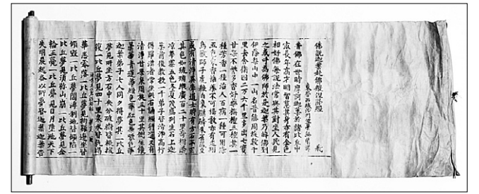
의성 운림사 아미타불좌상 복장유물 <불설가섭부불반열반경>

서울 개운사 목조아미타여래좌상에서 발견된 <개운사 목조아미타여래좌상 발원문>은 불상 개금 기록이 남겨진 '중간대사원문(中幹大師願文)' '최춘원문(崔椿願