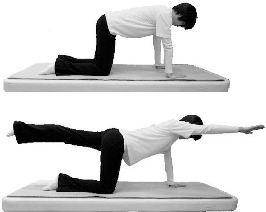
무릎 꿇고 양팔/발 번갈아 들기 1. 양 무릎과 양팔을 바닥에 붙인 채로 엎드린다. 2. 오른쪽팔을 쭉 펴면서 왼쪽으로 뻗는 동시에 왼쪽 다리를 쭉 펴면서 뒤쪽으로 최대한 밀어서 앞뒤로 최대한 늘려준다. 왼팔과 오른팔 다리로 같은 방법으로 실시합니다.