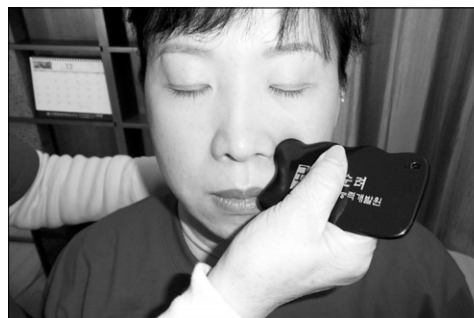
아토피 치료에 도움이 되는 팔사법.

이 항체는 히스타민(histamin)신체가 스트레스를 받거나 염증·알레르기가 있을 때 신체조직에서 분비되는 유기물질이다. 히스타민은 세포내에 존재하는 독성이 강한 화학 물질이다. 백혈구가 생성한 히스타민은 관절부위, 얼굴 등에 쌓인다.