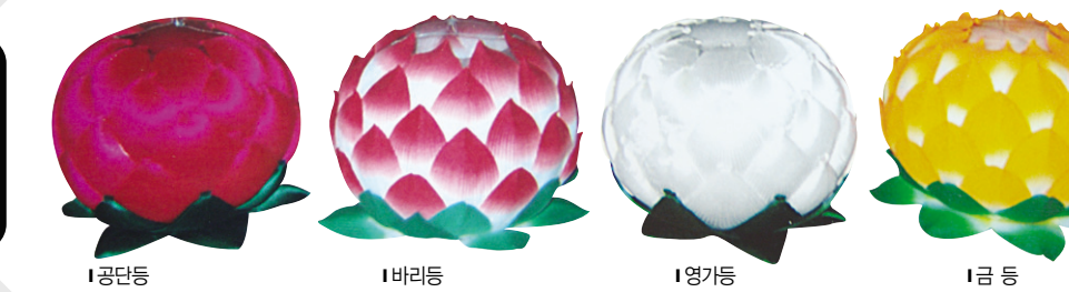
1 금단동 1 비리동 1 영가등 1 금등