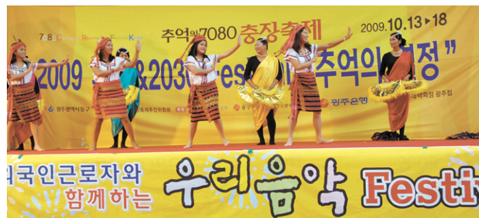
광주 외국인 근로자 복지센터가 외국인 근로자·다문화 가정을 위해 지난해 개최했던 행사 모습.