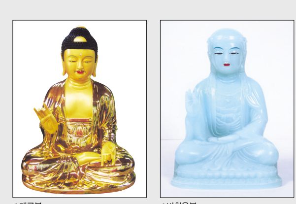
1 개금불 1 비취옥불 1 백옥불