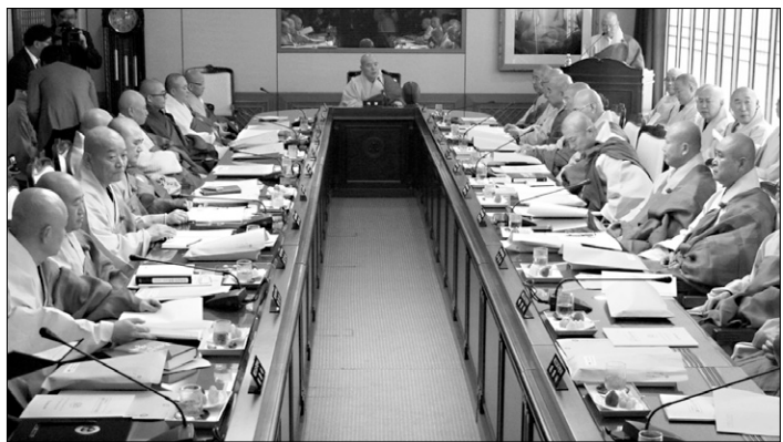
제33대 집행부 첫 교구본사 주지회의에서 각 교구본사는 종책현안에 대한 의견을 공유했다.

사찰 토지처분금은 교구본사별 토지처분금 총액과 상관없이 총무원이 중앙에서 관리·분배토록 했으나 이날 회의에서는 해당 교구본사가 총무원과 공동 예치해 직접한 뒤 해당 교구에서 활용하는 방안으로 변경됐다.