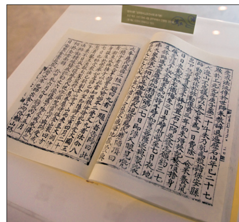
일연선사 생애관에 전시되어있는 삼국유사 범어사본. 조선 태조 3년(394)4월 간행.