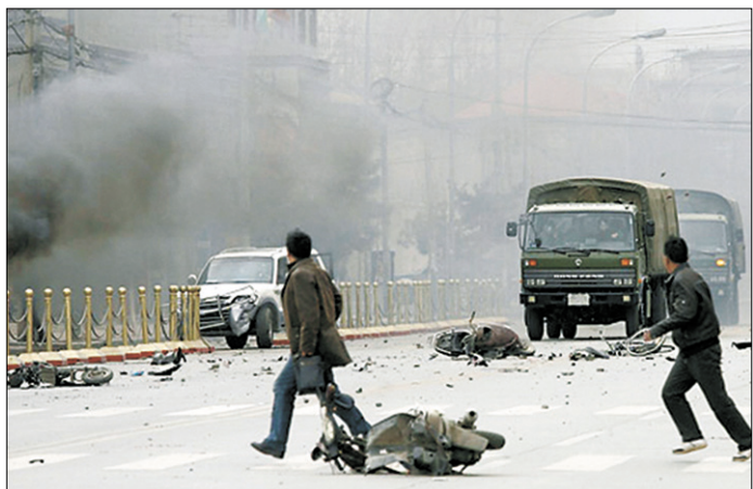
2008년 3월 라싸 사태 당시의 모습(현대불교 자료사진)

중국 쓰촨(四川) 성의 티베트인 거주지역에서 2월 15일 티베트인 400여 명이 반중(反中) 항의 시위를 펼쳐 다 경찰과 대치했다.