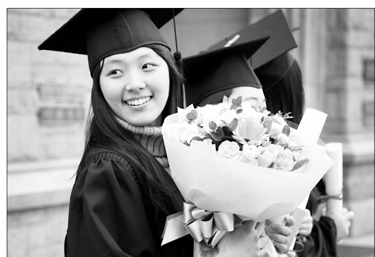
지랑스런 동국인이여, 그대의 미소가 아름답다.

동국대(총장 오영교)는 2월 19일 오전 11시 서울 중구 대학본관 중앙당에서 2010학년도 전기 학위수여식을 개최했다. 학위수여식에서는 박사 85명, 석사 532 명 등 2431명이 학위를 받고 사회 속으로 의 힘찬 출발을 알렸다.