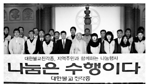
진각종은 2010년 ‘나눔은 수행이다’를 주제로 지역주민들에게 적극 나선다.