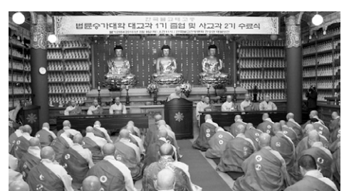
이날 졸업식에서는 정통법맥의 자긍심을 가진 84명의 태고종 스님들이 졸업했다.

중앙사정원장 윤국 스님은 축사에서 “어려운 여건에도 신심 하나로 이력종장(履歷宗匠)이 된 여러분을 진심으로 축하한다”며 “강원이 설립된 것은 법난 이후 약화된 전통법맥을 이어달라는 뜻으로 태고종의 자긍심과 책임감을 갖고 종단