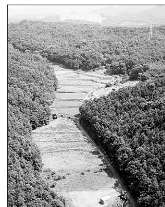
같은사지 전경(위)과 용인 불당굴 사지.