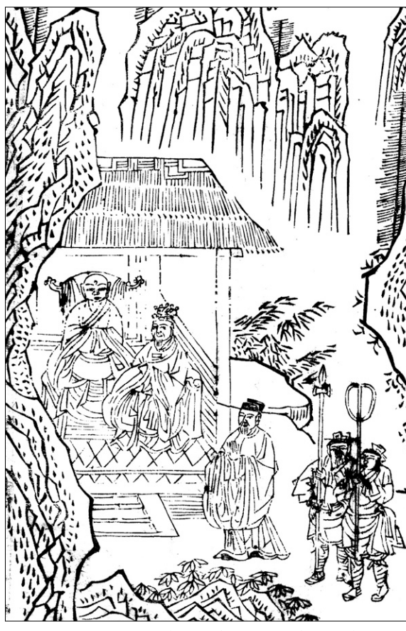
고판화박물관 소장 <석씨원류(釋氏源流)> 중 민왕문도(閩王問道). 불암사판 1673년간행, 반곽(半郭) 27.2×18.0cm

이 아뢰었다. "원하옵건대 생사의 큰일을 개시해 주십시오." 스님이 말했다. "진여의 불성은 삼세의 모든 부처님과 12부의 경전이 모두 왕의 본성 안에 스스로 구족돼 있습니다. 이는 또한 구할 필요가 없으니 꼭 스스로 자신이 구제해야만 합니다. 아무도 상대하여 구제해 주는 사람은 없습니다. 만약 부처가 되려거든 마땅히 스스로 제도해야 합니다. 만약 유일한 진여의 자성만 깨닫는다면 많은 말이 필요 없습니다. 부처님께서 '공음이 없는 곳으로 가야 도를 증득하게 될 것이다' 라고 하셨습니다. 원컨대 대왕께서는 오직 본성만을 비추어 보십시오. 만약 환하게 본성을 보게 된다면 모든 것을 스스로 달롱하게 됩니다." 이 내용은 복을 짓는 과보는 극락에 태어날 수 있으나 그 복이 다하면 다시 윤회의 수레바퀴를 벗어나지 못함을 일러 주고 있다. 우리는 자신의 성품을 깨닫는 것이 윤회의 수레바퀴를 벗어나 영원한 자유를 누리는 길임을 알고 스스로가 깨달음을 위해 끊임없이 노력해야 할 것이다.