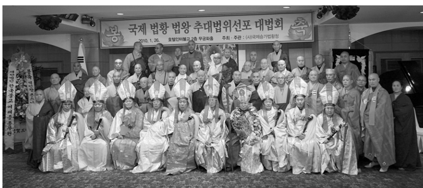
▷ 2010년 1월 26일 국제승가법황청 설립 선포 및 취임법회

(※ 종단별로 세계평화와 한국불교 흥흥을 위하여 평화대사 58명이 임명되어 현재 활동중임)