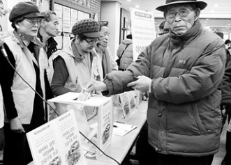
탑골인 봉사단 어르신들이 모금활동 홍보를 하고 있다.

픈을 겪고 있는 아이티 국민들에게 따뜻한 마음과 재건의 희망을 전하기 위해 모금활동행사를 마련했다"며 "내가 갖고 있는 것이 크든 작든 나누는 것이 '자비구원'이고 '동체대비' 사상"이라며 이윤 어르신들에게 많은 참여를 당부했다.