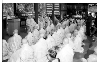
1월 20일 봉행된 (재)일불선교종 신년하례법회.

(재)대한불교일불선교종(총무원장 화엄)은 1월 20일 인천 호불사에서 ‘경인년 신년 하례법회’를 봉행했다.