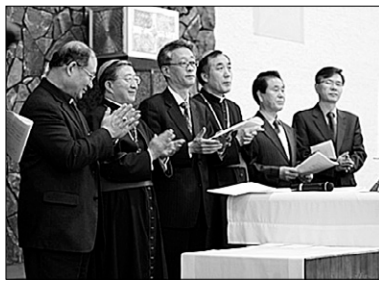
그리스도교 지도자들이 교회일치와 화합을 염원하며 아침기도를 하고 있다.

이후 로마교황청·동방정교회·성공회·세계교회협의회 등이 그리스도인 일치기도주간으로 하자는데 합의했다. 이나은 기자