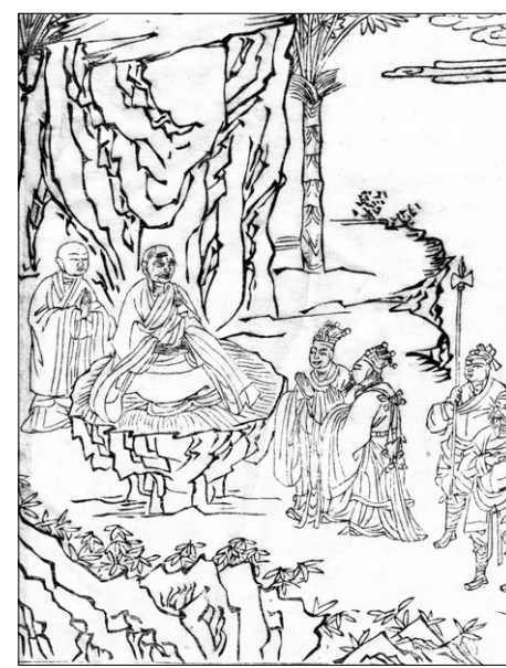
고판화박물관 소장 <석씨원류(釋氏源流)> 중 '이왕문법(二王問法)', 불암사판 1673년간행, 반곽(半郭) 27.2x18.0cm

<석씨원류>에 등장하는 이 삽화는 당나라 때 조주 스님이 연나라 왕과 조나라 왕에게 법문을 내리는 장면을 판각한 작품이다. 종심 스님의 호는 조주, 시호는 진제, 법명은 종심, 속성은 학씨이다. 778년 산동 임지현에서 태어나 송산 소림사에서 구족계를 받았다. 남전산의 남전보원(南泉普願, 748~835) 문하에 입문해 법을 이었다. 80세 때부터 조주성(趙州城) 동쪽 관음원에 머물러 호를 조주라 했다. 검소한 생활을 하고 시주를 권하는 일이 없어 고불(古佛)이라는 칭송을 들었다. 897년 120세로 입적했으며, 제자들에게 사리를 줌지 말 것을 유언으로 남겼다. 조주 선사 사담들로부터 존중을 받게 된 것은 100세가 넘어서의 일이며 조나라 왕인 왕용과 연나라 왕인 유인공이 전법을 시작하려다가 스스로 멈추고 조주 스님의 설법을 청하여 들은 것이 그 시작이었다고 한다. 본문의 내용을 살펴보면 "조주 스님은 왕을 보고도 단정하게 앉아 일어나지 않자 연나라 왕이 물었다. '사람의 왕이 존귀합니까? 법의 왕이 존귀합니까?' '사람 가운데 있게 되면 사람들의 왕이 존귀하고, 법 가운데 있게 되면 법왕이 존귀합니다.' 이에 연 왕이 승복할 따름이었다. 왕들이 설법을 청하자 조주 스님이 말했다. '세존께서는 한번 명호만 칭명해도 죄가 소멸되고 복이 생깁니다. 그런데 대왕들의 선조들께서는 어떤 삶이 그 이름에 접해 입만 때는 사람이 있거만 해도 골진