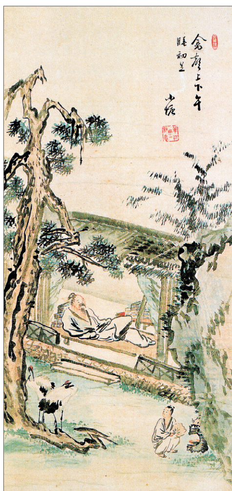
이재관 '오수도', 조선 19세기, 수묵담채, 122.0x56.0cm, 삼성미술관 리움 소장

그러나 간결하게 표현된 동자의 모습에서도 특이 얼굴만큼은 섬세한 붓질을 가한 것을 볼 수 있다. 이는 다양한 화폭 중에서도 초상화에 뛰어났던 이재관의 이력을 반영한 것이라 여겨진다. 이재관은 19세기에 전문적인 직업화가의 길을 걸었던 인물로 사실 그의 생애에 관해 알려진 바가 거의 없다. 그러나 인물화에 뛰어난 정실 궁정화원이 아닌에도 불구하고 태조의 어진(御眞, 임금의 초상화)을 베껴 그린 공으로 벼슬까지 얻었고 추사 김정희(金正喜, 1786~1856)의 소개로 문인사대부의 초상화를 여러 점 남기고 있다. 김정희의 문하에 있던 조희룡(趙熙龍, 1789~1866)과는 또한 평생의 지기로 교류했는