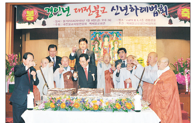
1월 8일 거행된 대전불교신년하례법회서 참가자들이 대전불교 발전을 기원하는 덕 절단 후 건배하는 모습.

대전불교사암연합회(회장 도안)와 백제불교회관(관장 장곡)은 1월 8일 대전 오페라컨벤션센터에서 대전불교신년하례법회를 봉행했다.