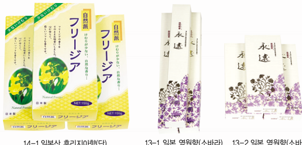
14-1 일본산 후리지아(향단) 13-1 일본 영원향(소바라) 13-2 일본 영원향(소바라)

우창산업 SHC 삼환종합양초 인터넷 홈페이지 www.shcandle.net