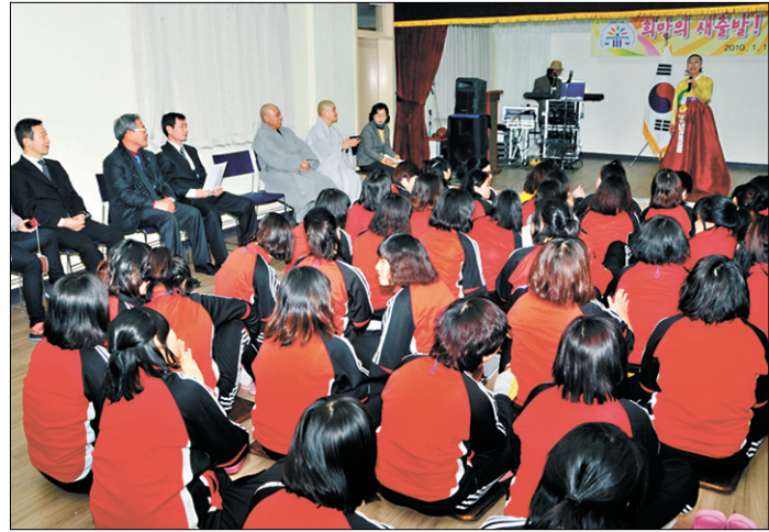
청원 석문사의 청주소년원 위문공연 모습.