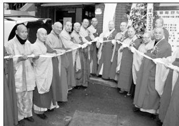
대한국불교조계종 스님들이 현판식에서 수행정진을 다짐하고 있다.

대한국불교조계종(총무원장 덕산)은 1월 11일 부산 동해구 명장동 육선사에서 전국비구니원 개원·현판식을 봉행했다.