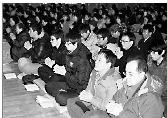
행원심인당에 운집한 진언행자들이 서원불공 회향불사에서 자심선행을 발원하고 있다.

진각종은 서울 총인원 탐주심인당과 미국 LA 불광심인당 등 국내·외 각 심인당에서 1월 4~10일 1주 동안 봉행된 2010년도 경인년 새해대서원불공 회향했다. 진언행자들은 경인년 새해대서원불공에서 진각종 서원덕목인 △인류의 심성정화로 평화공존 △정치의 경제의 발전으로 국민생활 안정 △상생협력의 덕행실현으로 사회의 통합 △교법 법광 스님 등 종단 중진 스님들과 종도 50여명이 참석했다.