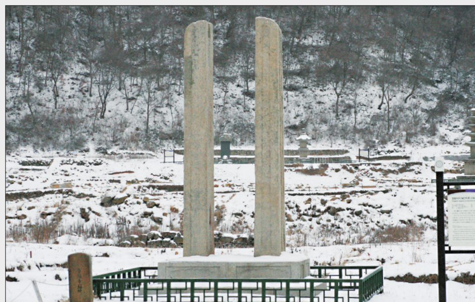
옛 보원사의 규모를 짐작케하는 당간지주.

기는 955년입니다. 그러니까 질병을 앓아 극락세계로 반야용선을 타고 가려다가 '몽매에 통하여' 다시 이승의 삶을 이은 것이 20년이나 되는 셈입니다.